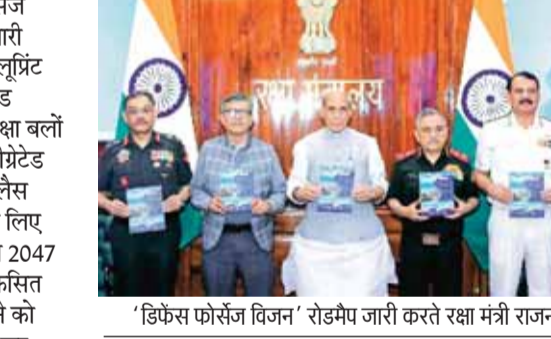
'डिफेंस फोर्सज विजन' रोडमैप जारी करते रक्षा मंत्री राजनाथ सिंह

ज्यादा तालमेल को बढ़ावा मिलेगा इसमें सेना को एक इंटीग्रेटेड, मल्टी-डोमेन और फुल्टीली फोर्स में बदलने की ओर बढ़ाई गई है, जो दुश्मनों को रोकने, हर तरह के झगड़े में जवाब देने और तेजी से बदलते क्लोबल और रीजनल हालात के बीच बढ़ते स्ट्रेटेजिक हिंसों की रक्षा करने में कबिल हो। इस विजन का एक मुख्य हिस्सा सेनाओं के बीच तालमेल और तालमेल पर जोर देना है, जिससे प्लानिंग, ऑपरेशन और क्षमता विकास में ज्यादा तालमेल को बढ़ावा मिलेगा।