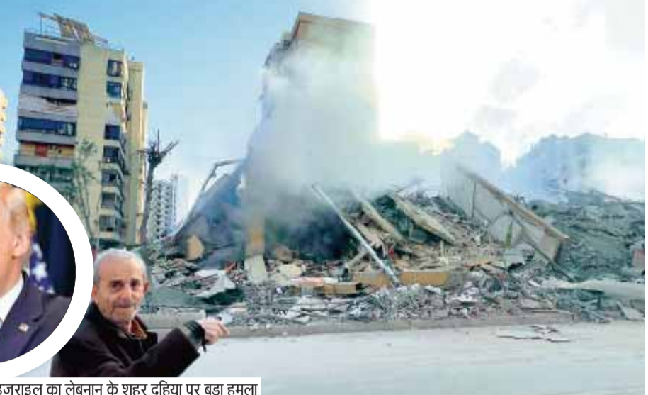
इजराइल का लेबनान के शहर दहिया पर बड़ा हमला

युद्ध को लेकर अमेरिका का प्लान 'समय से आगे' चल रहा