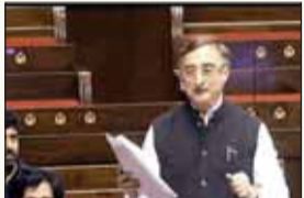
विवेक के. तन्खा

छिंदवाड़ा में जहरीले कफ सिरप के सेवन से 35 से ज्यादा मासूम बच्चों की दर्दनाक मौत का मामला फिर राज्यसभा में उठा। कांग्रेस के राज्यसभा सांसद विवेक के. तन्खा ने संसद में केंद्र सरकार को घेरा। तन्खा के सवालों के जवाब में