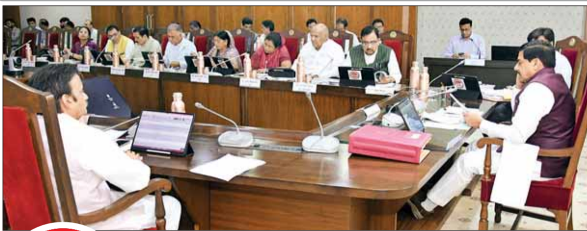
मुख्यमंत्री डॉ. मोहन यादव कैबिनेट बैठक में निर्देशित करते हुए

योजना को अटल बिहारी वाजपेयी सुशासन संस्थान के माध्यम से संचालित किया जाएगा। इसमें युवाओं को ब्लॉक स्तर पर सरकार की योजनाओं का जमीन स्तर पर इमैक्ट और क्रियान्वयन में आने वाली कठिनाइयों की जानकारी को एकत्रित करना होगा। इसमें 4,865 युवा इंटरनेट के रूप में काम करेंगे। प्रारंभ में हर ब्लॉक से 15 युवाओं को योजना से जोड़ा जाएगा। सरकार द्वारा जनता के लिए कई तरह की स्क्रीम और सरकारी योजनाएं संचालित की जा रही हैं। इंटरनेट करने वाले युवाओं को इन योजनाओं की जमीनी हकीकत पता करनी होगी।