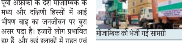
मोजाम्बिक को भेजी गई सामग्री