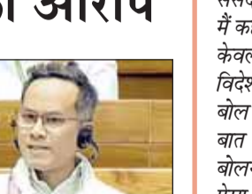
गौरव गो गोई

किस आधार पर महिला सांसदों पर आरोप लगाए: गो गोई बहस की शुरुआत कांग्रेस सांसद गौरव गो गोई ने की। उन्होंने कहा कि बजट सत्र के दौरान 20 बार नेता प्रतिपक्ष राहुल गांधी को रोका-टोका गया। उन्हें बार-बार रूलिंग बुक दिखाई गई।