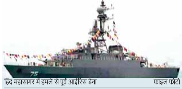
हिंद महासागर में हमले से पूर्व आईरिस डेना फाइल फोटो

ईरान के जहाज आईरिस डेना पर हिंद महासागर में हुए हमले को लेकर अमेरिका के राष्ट्रपति डोनाल्ड ट्रंप की पहली प्रतिक्रिया सामने आई है। उन्होंने कहा है कि उनके सैनिकों को ईरानी जहाजों को डुबोने में मजा आ रहा है। उन्होंने अपने अधिकारियों से हुई बातचीत का किस्सा सुनाते हुए कहा कि उन्हें 'ईरानी जहाजों को मारकर डुबोने में मजा आ रहा है।' डोनाल्ड ट्रंप ने यह भी दावा किया कि अमेरिकी सेना ने पिछले साढ़े तीन दिनों में ईरानी नौसेना के 46 जहाजों को डुबो दिया है।